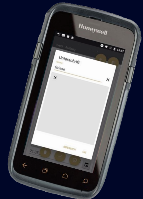
Auftrag mit digitaler Unterschrift