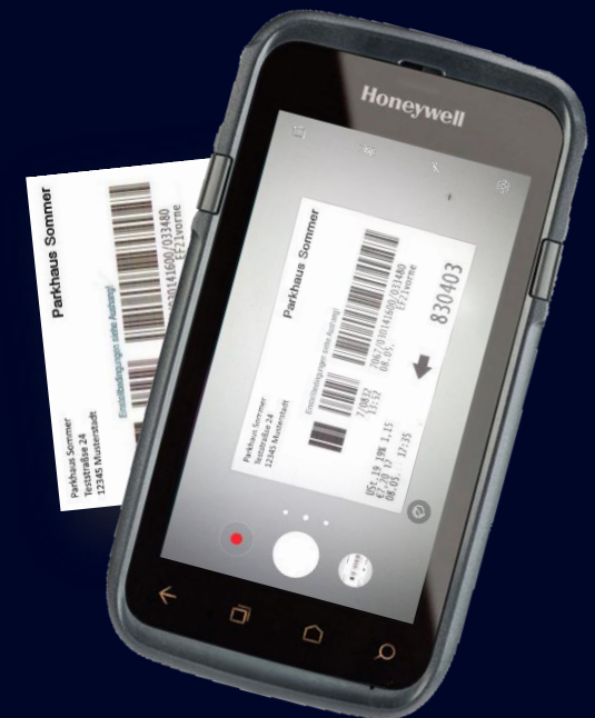
Spesenbeleg per Foto erfassen